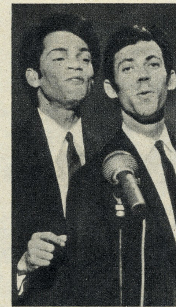
8 — «TENHO AMOR PARA AMAR». Intérprete: DUO OURO NEGRO