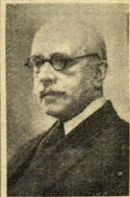
Dr. Julio Dantas

Em «Elogio do sorriso» agora publicado, Julio Dantas oferece ao publico uma das facetas em que é, hoje, incomparável: o filósofo. A graça sorridente, o comestor profundo em ironia, o optimismo saudável, a análise subtil do que se pode chamar a comédia contemporânea — passam neste livro, a que dedicamos em breve mais larga referência, e que constitui um clarão luminoso e suave na literatura de uma época que parece cada vez mais orientar-se para a negação de si-própria e de quanto é eterno e belo. Julio Dantas o diz, como só ele o sabe dizer: «Sorrir é compreender, é absolver, é — já o diz Bergson — educar». E o autor de tanta obra-prima da nossa literatura contemporânea sabe, como ninguém absolver, compreender, e educar — a sorrir.