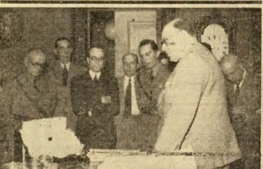
O Ministro do Interior discursando no acto de posse do Conselho Nacional dos Serviços de Incêndios — (Ler notícia na 4.ª página)