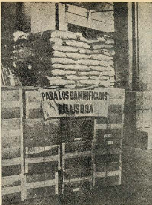
Caixas e sacos com cobertores, vestuário, víveres e medicamentos, provenientes de toda a Espanha e destinados às pessoas afectadas pelas enxurradas do dia 25, em Lisboa e nos arredores, aguardam transporte, no depósito central da Caritas espanhola.

Uma ideia simpática: os filhos de centenas de famílias que a catástrofe de há duas semanas deixou sem recursos beneficiarão da festa de Natal organizada anualmente pelo Grupo Cultural Desportivo da T.A.P. Os meninos dos aviões ficam este ano sem brinquedos. Quem os recebe? Crianças recolhidas por várias entidades assistenciais. A festa é no dia 17, na sala de teatro do Monumental.