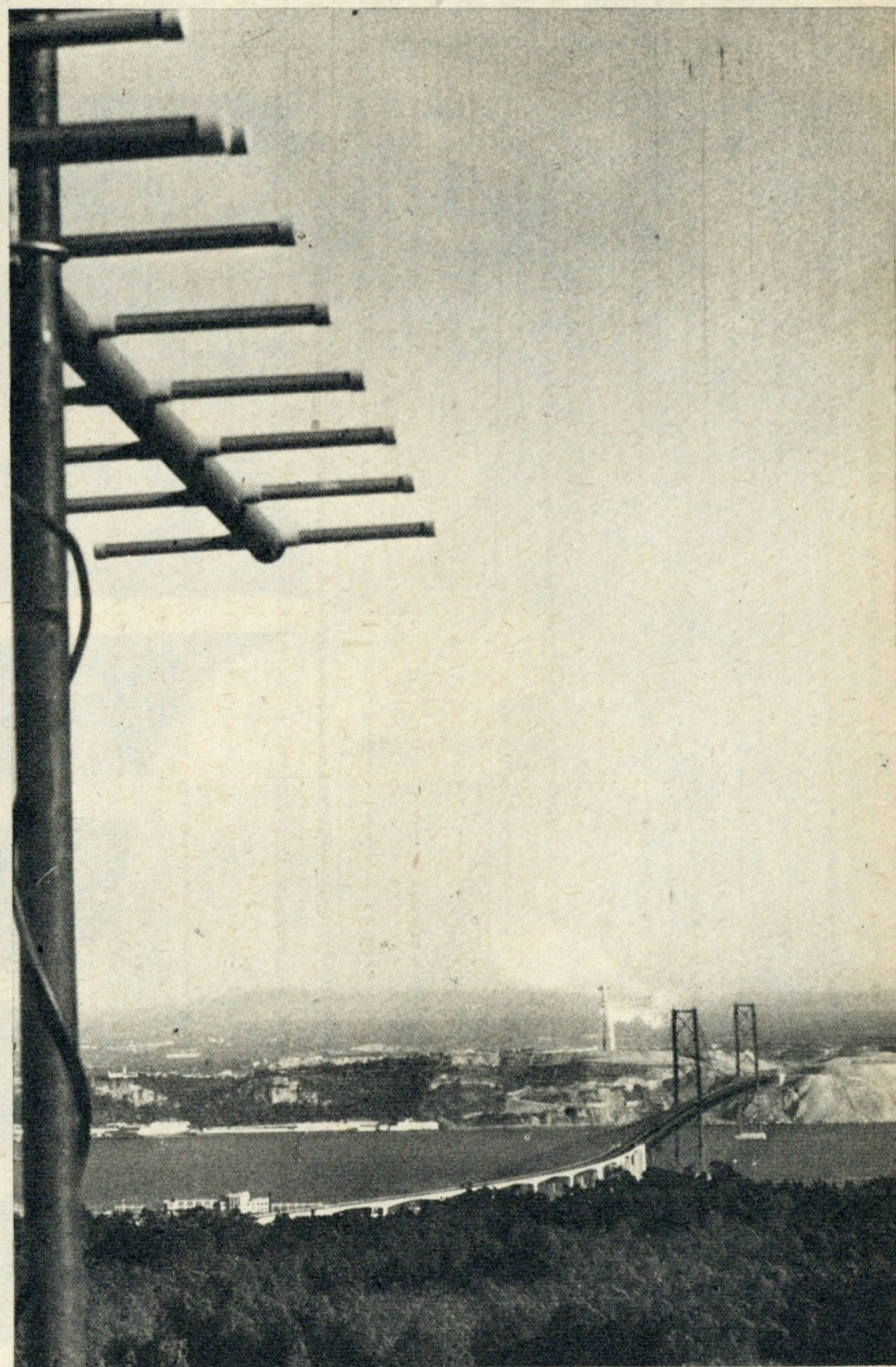
A Ponte sobre o Tejo vista do 1.º andar da torre do Emissor de Monsanto da R. T. P.

O início da montagem efectuou-se no passado dia 25, estando previstos os primeiros ensaios para o dia 4.