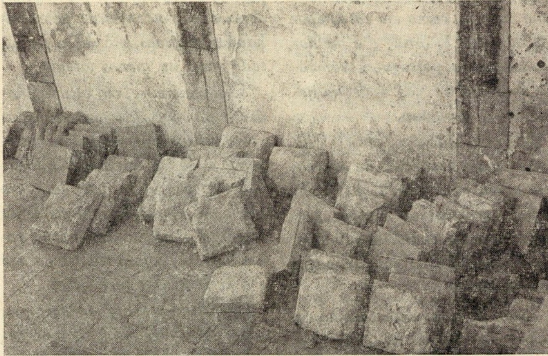
Sob estas pedras quizeram fazer até à Ressurreição Final os nossos maiores

Participaram na conversa alguns membros da comissão, e o nosso Director ofereceu a Sua Eminência uma colecção dos números de «O Sesimbrense» onde o assunto tem sido tratado