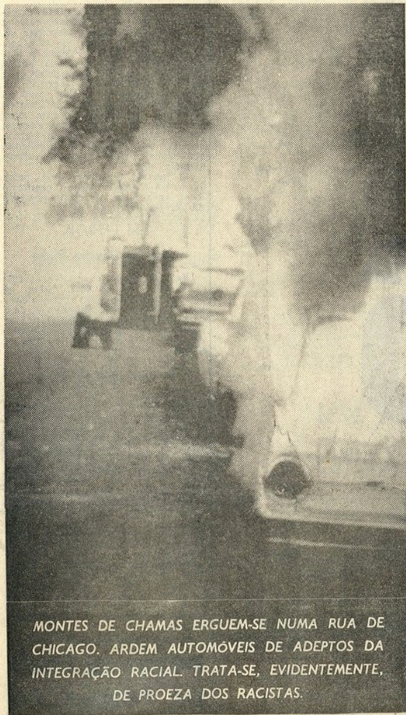
MONTES DE CHAMAS ERGUEM-SE NUMA RUA DE CHICAGO. ARDEM AUTOMÓVEIS DE ADEPTOS DA INTEGRAÇÃO RACIAL. TRATA-SE, EVIDENTEMENTE, DE PROEZA DOS RACISTAS.

• VAI SER PEDIDA AO CONGRESSO A RESTRIÇÃO DA VENDA DE ARMAS