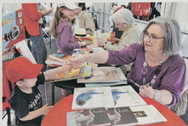
A escritora na Feira do Livro de Lisboa

Já o Congresso do Ensino Superior de Design realiza-se nos dias 6 e 7 de Novembro nas instalações da Culturgest e conta com o apoio da BEDA. ■ LUSA