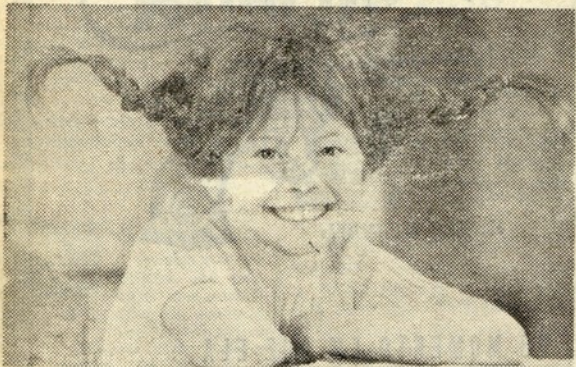
Pippi, a garota endiabrada