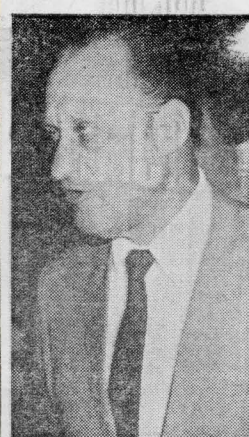
Dr. João Havelange, presidente da Confederação Brasileira dos Desportos